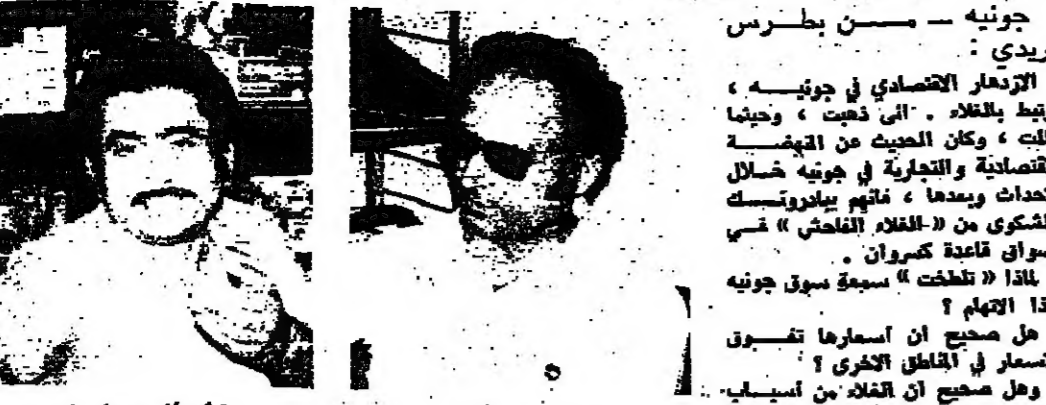
جنوبه - من بطرس كريدي

الازدهار الاقتصادي في جنوبه ، اربط بالغلاء ، الى ذببت ، وحينها حلت ، وكان الحجة من القهسة الاقتصادية والتجارية في جنوبه خلال السنوات الماضية ، وتتميز بوفرة المنتجات والحدائق من «الغلاء الفلحي» في اسواق قاعة كسروان . لماذا «تطخت» سيدة سوق جنوبه بهذا الغلاء ؟ هل صحيح ان اسعارها تقبض الاسعار في المناطق الاخرى ؟ وهل صحيح ان الغلاء من اسباب الازدهار التجاري في سوق جنوبه ؟ هذه الاسئلة والاهتمامات حياها الى تجار جنوبه ، مؤسستها التجارية . محطتا الاولى كانت في مؤسسة جنوبه سوبر ماركت لصاحبها جنبا وبولس نهد . وبولس نهد نفي التهمة وقال : ان مؤسسة لم تستغل القاس اتفه الأحداث ، فهي موجودة منذ وقت طويل ، ويشهدنا الزمان من المناطق اللبنانية كافة . ولقد كانت مؤسسة ونحن نعمل على بيع جراح الغلاء ، واعتماد الاسر المثل . وتابع : ان هذا لا يعني عدم وجود غلاء ، المشكلة موجودة ، لكنها لا تعود الى ما اشيع من استغلال واحتكار اقربهمها تجار جنوبه . الزبائن . بل والصق يقال لشباب المؤسسة بولس نهد ان اسباب الغلاء تكمن في ارتفاع اسعار البضاعة المستوردة في بلدنا ، وفي ارتفاع اسعار العملات الأجنبية . وقال بولس نهد : وفي رسوم التخليق والتحصن ، علما بلنا نتمتع على تلبين حاجات المستهلك من السوق المحلية ، ولا نلجا الى السوق الخارجية الا في حال فقدان السلع المطلوب . وقال ان الحل يكمن في خفض المراجعة التجارية ، مع المحافظة على التوعية ، وفي ابقاء الاستيراد ، دون التقييد بخصم مبيضة ، وترك القاسية الصرة تنفذ مداها . دعا الى انشاء المرسوم رقم (٢٢) للتصديق على الغلاء والوصول الى الهدف ا حود . يقتضي